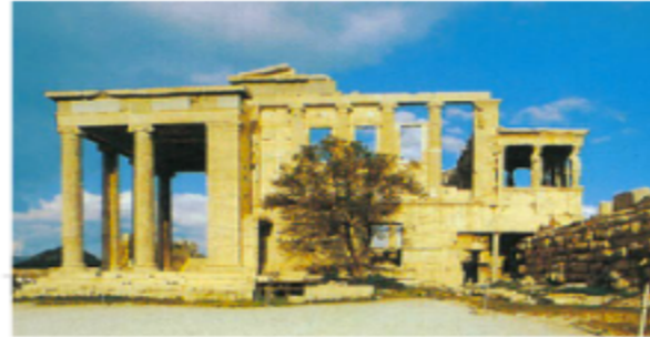
7. Il mitico ulivo di Atena, sull'acropoli, accanto all'Eretteo, dedicato al culto della dea nel secolo V a. C.

Gli efori , anch'essi eletti dall' apella , ma su designazione della gerusia (che in questo modo se ne assicurava il favore), erano cinque e rimanevano in carica per un anno. Questi magistrati detenevano il potere effettivo: proponevano le leggi, controllavano l'educazione, amministravano la giustizia.