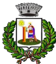
Comune di San Vito Romano