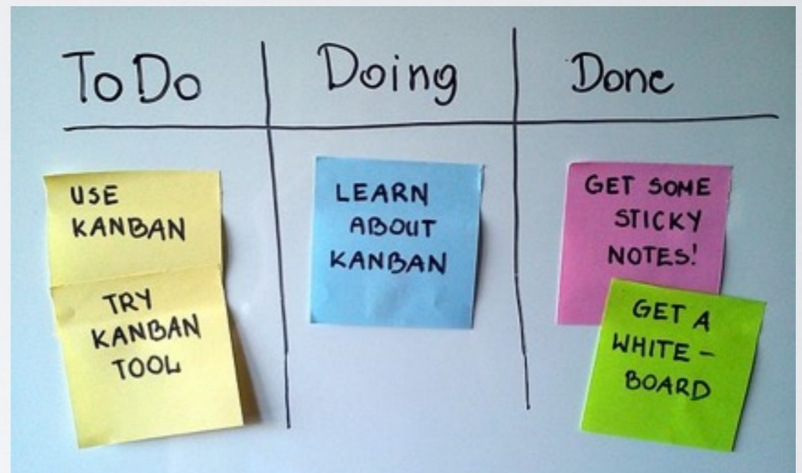
"Simple-kanban-board-" by Jeff.lasovski