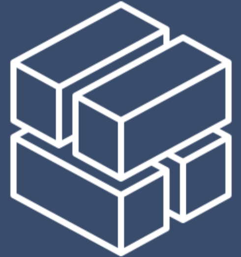
Modalità di consultazione