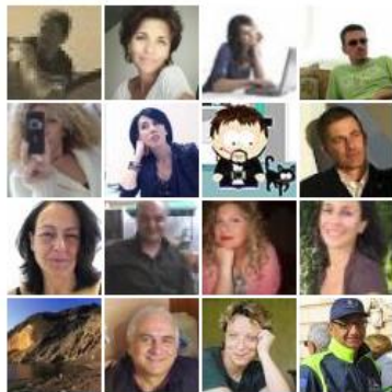
tutti i partecipanti