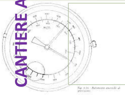
Fig. 4.33 - Barometro associato al processo.