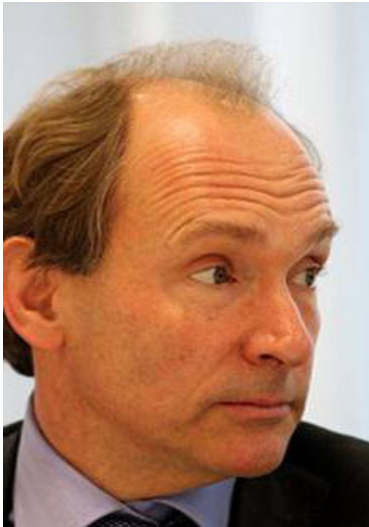
Tim Berners Lee

I social network, gli accademici, i musicisti, i governi dovrebbero condividere di più le informazioni online: