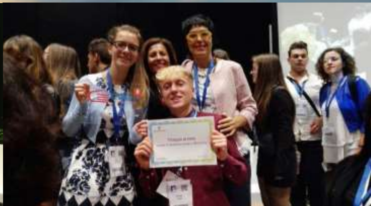
Publicata da Costantina Coscu Visualizzazioni: 488