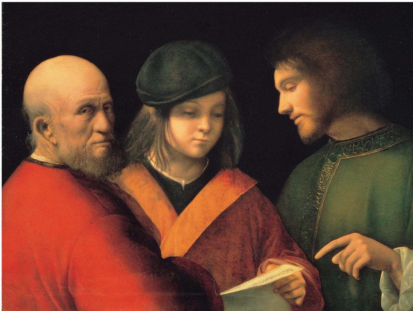
Le tre Età dell'uomo (Giorgione, 1507)